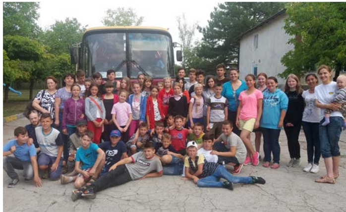
Ett härligt gäng i färd med att åka till lägergården.

Det kristna livet kräver övning. Paulus uppmanar oss att ”öva oss i gudsfruktan” och att kroppsliga övningar ”i någon mån” är nyttiga. Men framför allt pekar han på de andliga övningarnas nytta. Att lära sig känna igen Guds röst kräver övning. Att våga lita till Guds tilltal, kräver övning. Personligen tror jag att vi måste ”öva oss” att känna tillit, förtröstan, att inte oroa oss (i onödan). Alla dessa trons egenskaper kräver sitt mått av övning. Att våga tro kräver också sitt mått av arbete och övning. Tron är visserligen en gåva, men vi måste också ”öva oss att tro”. Med det menar jag att vi i vår vardag låter tron få vara en naturlig del, där vi är öppna för den helige Andes tilltal. Kroppsliga övningar är nyttiga och har sin givna plats, men för den troende är också de andliga övningarna viktiga för det andliga livet. De är en absolut nödvändighet för att kunna växa som kristna. Dessa övningar har med vår andliga mognad att göra. Inte minst den andliga urskillningens gåva är oerhört central. Inte minst i den tid av andlig ”förvirring” som råder idag. Både i och utanför våra egna led. Öva er i gudsfruktan! Det är ord att fundera och bedja vidare över. Guds rika välsignelse över dig! Jag