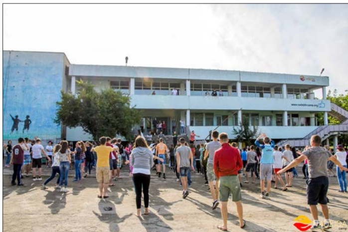
Den stora lägergården i Balti som samlar många ungdomar till nära upplevelser med Gud.