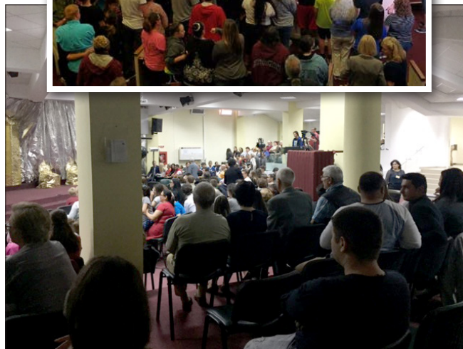
Bilder från dramaföreställningen i Galati. Många människor svarade på frälsningsinbjudan.