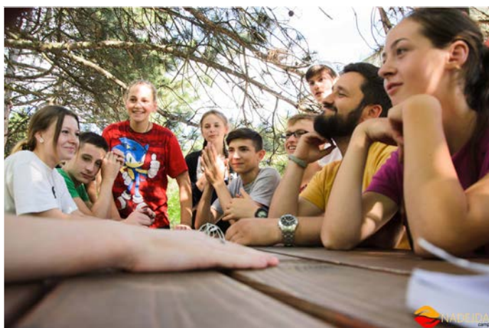
Man samlades i både stora och små grupper för undervisning och samtal.