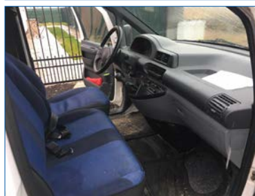
Inredningen är välvårdad.