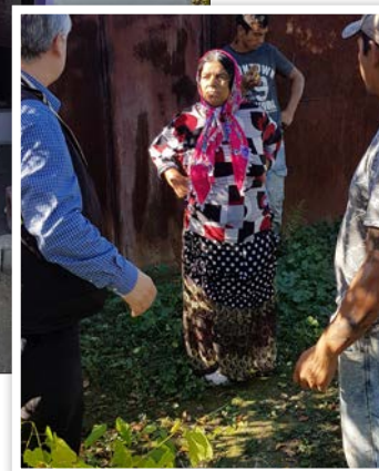
Nedan: Påskfirande hos Löftenas Barn. Utdelning av påskpaket.