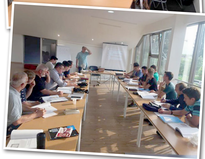
Både män och kvinnor får undervisning genom ASIST-programmet.