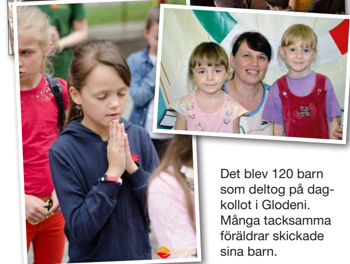
Det blev 120 barn som deltog på dagkollot i Glodeni. Många tacksamma föräldrar skickade sina barn.