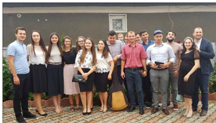
Några av församlingens ungdomar.