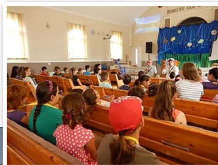
Pyssel, bibeltimma var några av aktiviteterna.

Idag är situationen en helt annan, flera av de som en gång lämnade, har kommit tillbaka. Nya människor har lagts till församlingen.