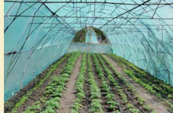
Förra årets tomatplantor.

Den här månaden lägger vi fokus på att kunna få våra växthus i bättre ordning. En pump och ett bevattningssystem är en növändighet för att få en god skörd. Tack för din gåva! Mätta de hungriga! Hjälp dem som är i svårigheter! Då ska ditt ljus lysa i mörkret, och mörkret omkring dig ska bli som en ljus dag. Jes 58:10