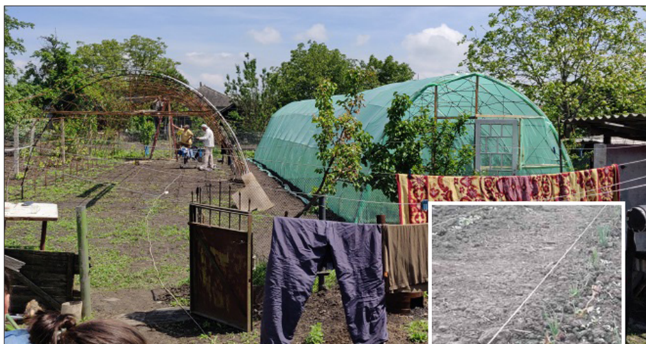
Detta är ett Herrens verk. Gjort av människohand, men helt och fullt byggt på Herrens initiativ. Nu önskar vi att detta skall bli en välsignelse för andra.