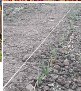
Löken är redan på väg upp.

Åter igen vill vi skriva några rader om det växthusprojekt som vi startade i Moldavien under förra året. Våren börjar nu göra sig påmind och odlings säsongen är redan igång inne i växthusen. Inför den här säsongen vill vi försöka sänka våra kostnader ytterligare. Helt nyligen har vi borrarat en brunn, för att vara mindre beroende av kommunalt vatten. Med alla avgifter kostar en kubikmeter ca 10 kronor, vilket med moldaviska mått är oerhört kostsamt. Enbart under den varma sommaren kan bevattningen bli mycket kostsamt. Alla kostnader som vi kan kapa, är viktiga för projektets framgång.