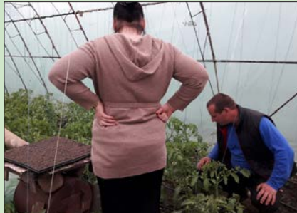
Jordmånen är mycket god och plantorna växer så det knakar. Gurkplantoerna kommer bli manshöga när de vuxit färdig.