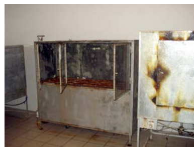
Bak- och jäsugn vid besöket 2010.

Utrustningen används varje vecka och brödet delas ut till ca 200 människor, har i grunden förändrat samhället. Det finns många vittnesbörd om människor som rörts till tårar över att de får del