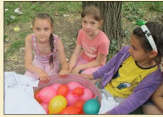
Många roliga aktiviteter hinns med under ett läger eller kollo.

Sommaren är snart här och det innebär att vi återigen vill kunna ge barnen i Moldavien en sommarupplevelse med Bibeln som grund. I år blir det två olika, ett sommarkollo för de yngre och ett läger för de äldre. Den sammanlagda budgeten är drygt 35 000 kronor. Varje barn kostar 250 kronor att sponsra och då ingår aktiviteter, mat och eventuell transport. Om budgeten medger, även en utflykt med buss.