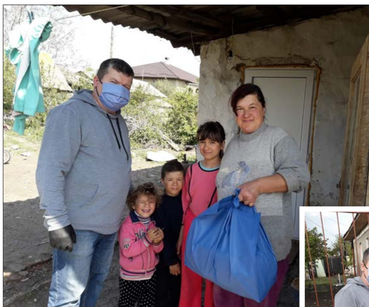
En av många familjer som fått besök under pandemin.

Vi känner att arbetet på inget vis är avslutat, utan vi tror att det ligger på Guds hjärta att vi finns med i detta arbete också i fortsättningen. Vi ser