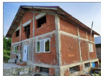
Mycket återstår innan huset är färdigt. Huset har nu isolerats utifrån.