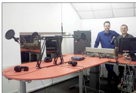
Den senaste studion som kommer användas för de nya satsningarna som skolan nu gör.