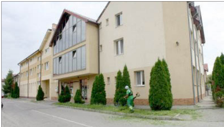
Mycket har hänt sedan vi första gången träffade skolans lärare och elever. Nu finns en byggnad som kommer betjäna skolan under många år.

Under mer än tio år har FTM-Mission funnits med i Östeuropeiska Bibelskolans arbete och utveckling. Vi har stöttat genom undervisning och även byggt två radiostudios och nu senast, byggt och donerat en ljudanläggning till den nya samlingsalen på skolan.