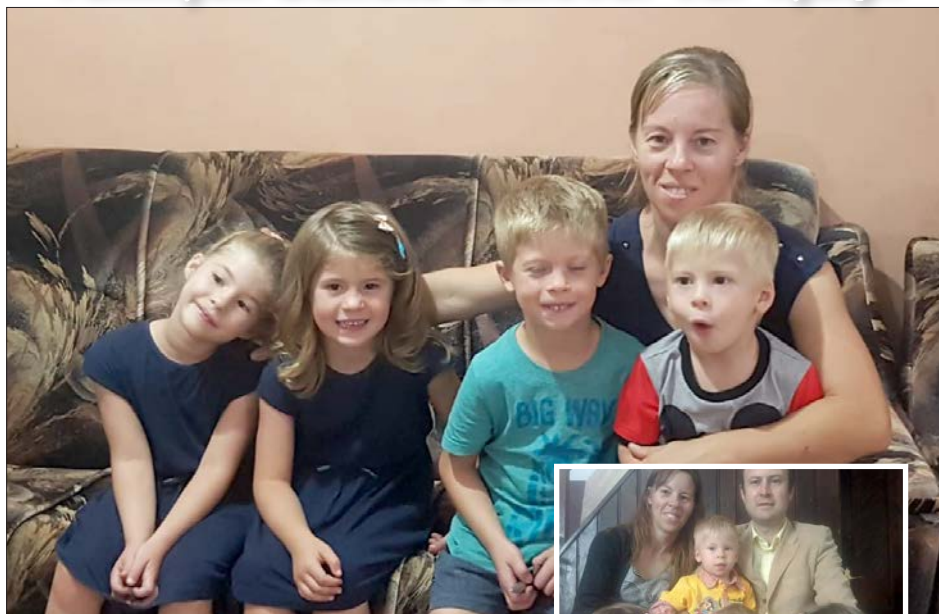
Rebeca tillsammans med de fyra barnen som hon nu är ensam om att ta hand om. På bilden till höger finns hennes nu avlidne make med.

Vi tackar Gud för den positiva utveckling som skolan nu ser. Vi beder att detta skall inspirera fler unga människor att vilja studera både teologi och media. Två viktiga komponenter för att vi skall kunna nå den nya yngre generationen och människor med evangelium.